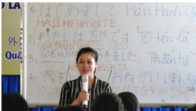
日本語の挨拶、自己紹介の授業風景（入学初日）

一定の日本語レベルに到達した生徒から特定技能 1 号技能測定試験合格に向けた講義を開始し、学生からの質問に対してベトナム語・日本語の 2 カ国語に対応したオンラインでの自習支援を行います。また、「和の精神」や「サービスとおもてなしの違い」など、日本企業で働く上で必須となる日本文化や社会人常識マナーについて、公益社団法人全国経理教育協会が提供する『社会人常識マナー Japan Basic』を用いて学習します。