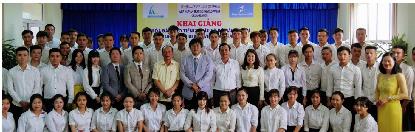
2019年4月26日 TRN 外食業トレーニングセンター開校式 所在地:ベトナム社会主義共和国 クアンビン省