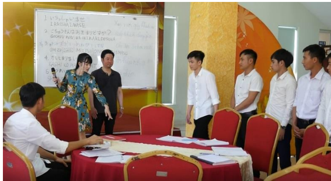
オーダーテイクのトレーニングの様子(入学 2 日目)